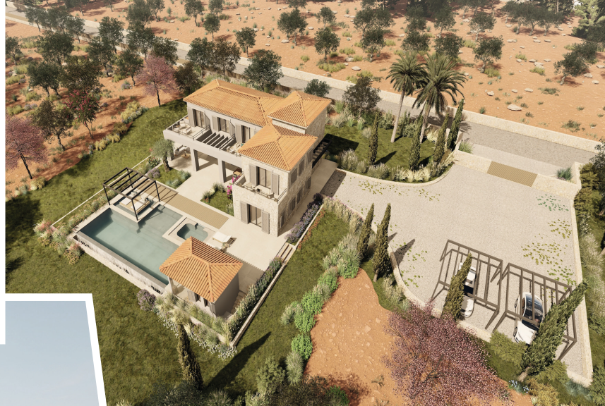
Wohlfühloase & großer Parkplatz