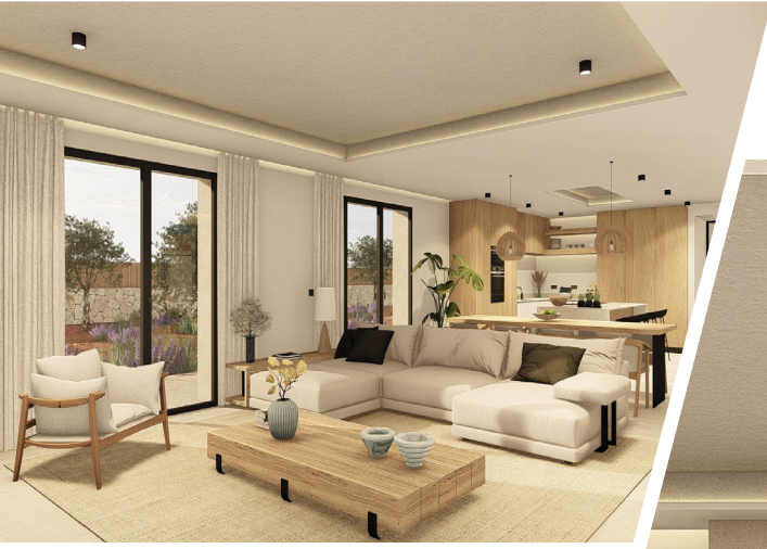
Größzügiger Wohn- und Essbereich mit offener Küche